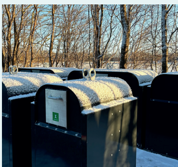
Miljøstation i Nysted

Nogle sommerhusområder har valgt at få miljøstationer. De ser således ud.