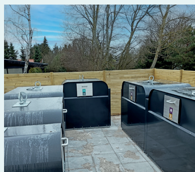
Miljøstation i Marielyst